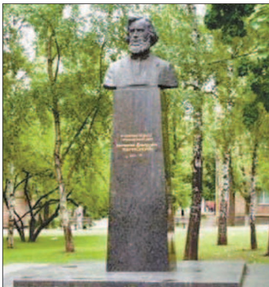
Памятник К. Д. Ушинскому в Киеве