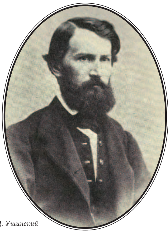
К. Д. Ушинский

Его отец, Дмитрий Григорьевич, был отставным офицером, участником Отечественной войны 1812 года, мелкопоместным дворянином. После назначения главы семьи судьей в старинный уездный город Новгород-Северский Черниговской губернии Ушинские покинули Тулу.